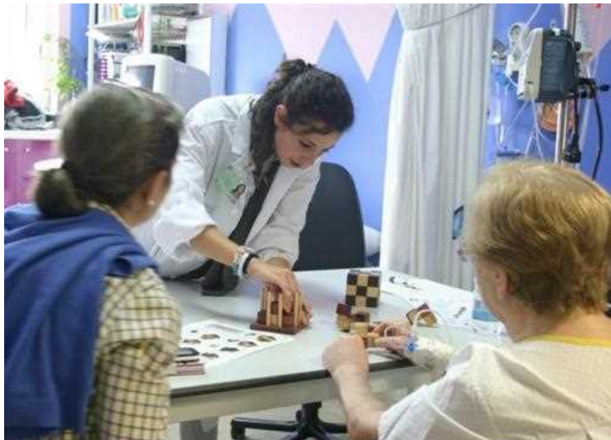
Imagen 2. Participación de una voluntaria en la sesión de fisioterapia del paciente junto al familiar, en la Neuroaula.

Las personas que aparecen han dado su consentimiento para su uso y publicación.