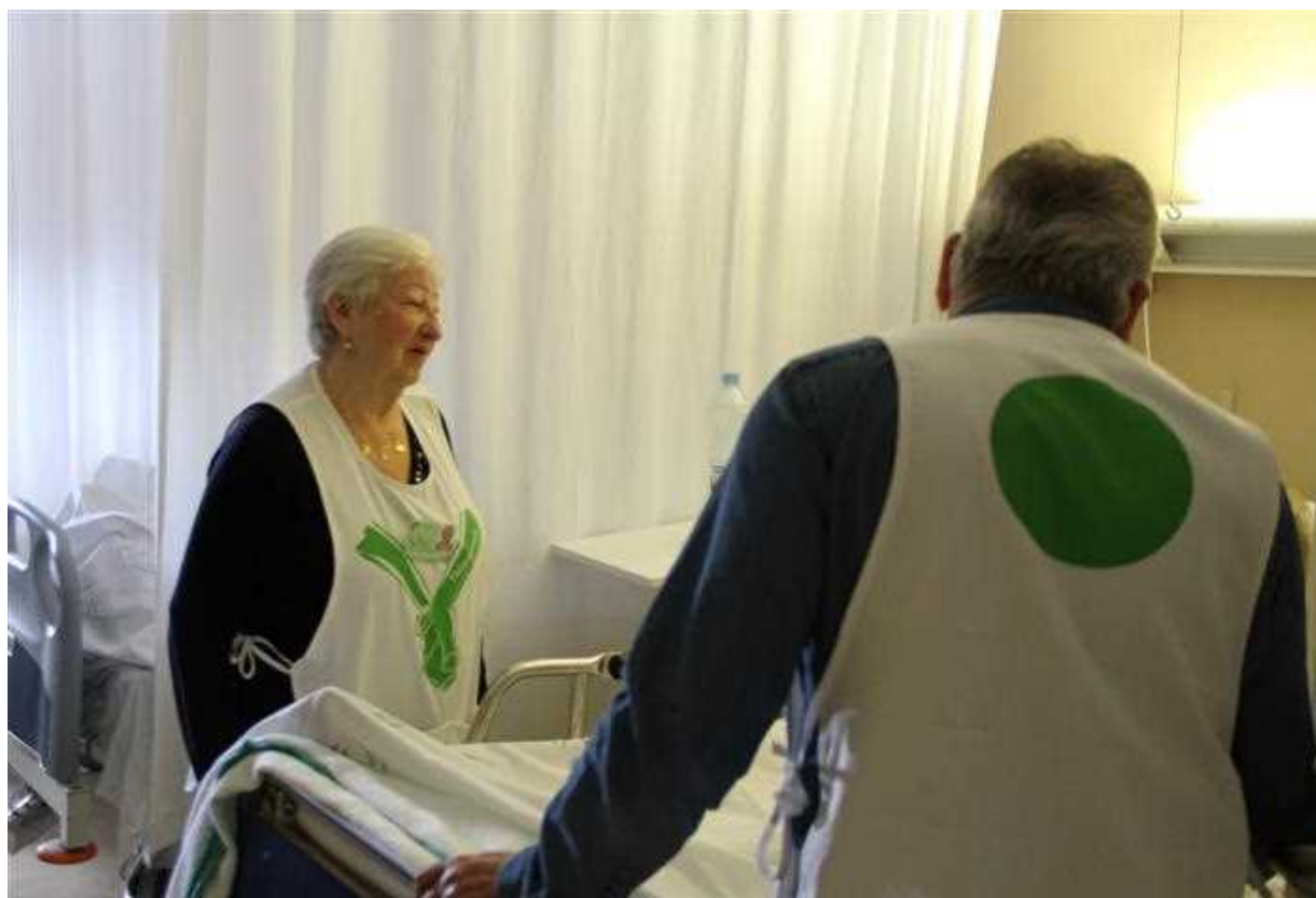
Imagen 1. Momento del acompañamiento de voluntarios a pacientes del programa ADELANTE.

Las personas que aparecen han dado su consentimiento para su uso y publicación.